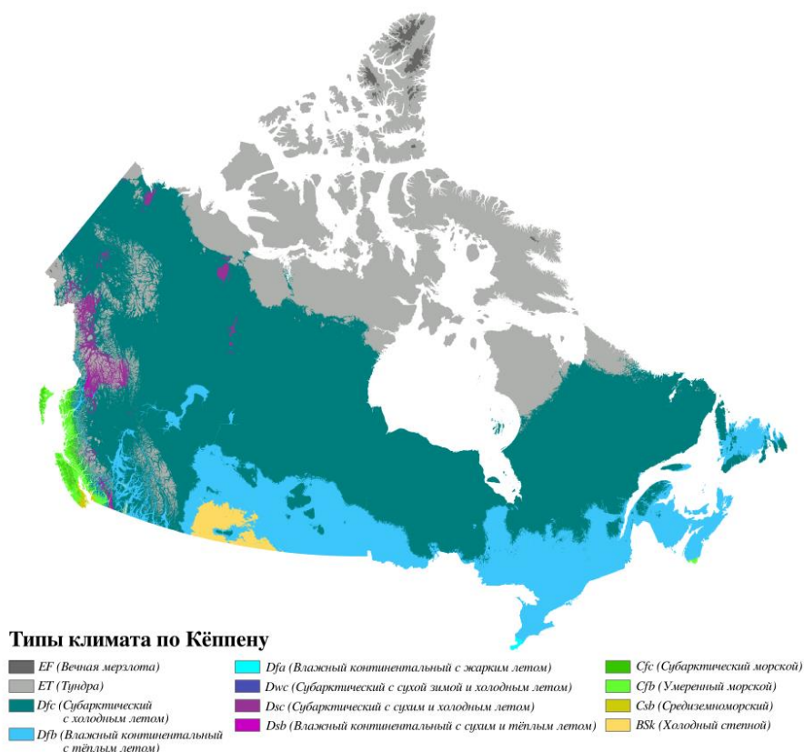
Рис. 1. Климатическая типология Канады по Кёппену [2]

Текст тезисов. Текст тезисов. Текст тезисов. Текст тезисов. Текст тезисов. Текст тезисов. Текст тезисов. Текст тезисов. Текст тезисов [1]. Текст тезисов. Текст тезисов. Текст тезисов. Текст тезисов. Текст тезисов. Текст тезисов.